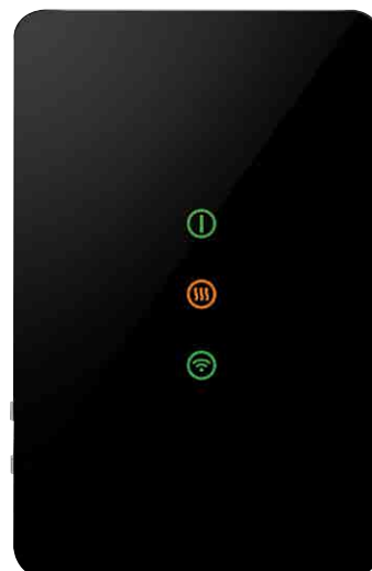
Relais SunStat R4

UL homologué sous UL 943, UL/CSA 60730, UL 991 Numéro de fichier d'homologation E365015.